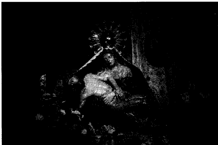
FIG. 1.—«Nuestra Señora del Risco»