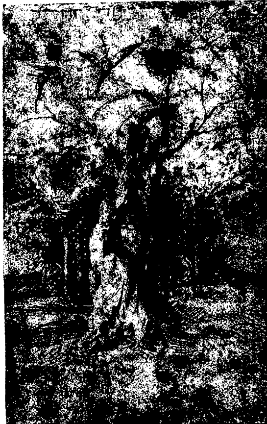
El Bosco, El bosque tiene oídos, el campo tiene ojos , 1502-1505

ce del eros y la paideia , tal es la idea central del Simposio ; ¿lo es también del Jardín de las delicias ? ¿Intenta el Bosco educar en el control de las pasiones? ¿O, simplemente, se limita a exponerlas sin establecer juicios de valor? Claro, que para eso están los infiernos bosquianos, y, el del Jardín es el más infernal de todos. Lo cierto es que difícilmente llegaremos a dar respuestas satisfactorias a los innumerables interrogantes que esta obra nos plantea. Si indagamos en el resto de su obra, algunas preguntas tienen respuestas.