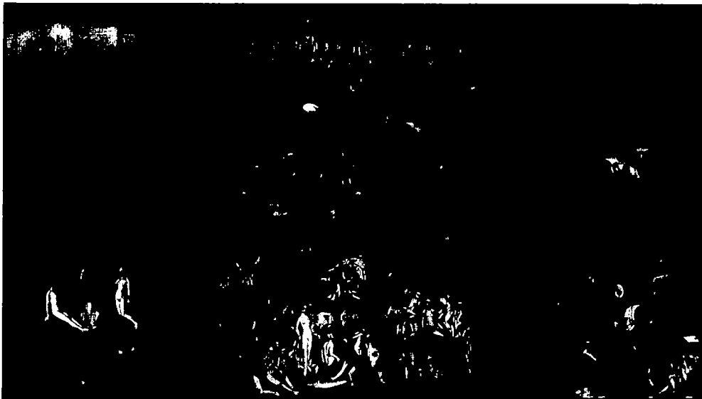
Hieronymus van Aeken «El Bosco », El Jardín de las delicias , 1490-1500